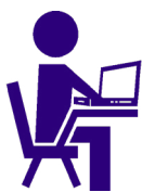
Station de travail + écran